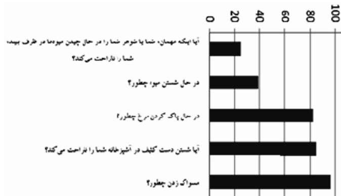
تصویر ۳. درصد پاسخ مثبت به پنج سؤال مرتبط با فعالیت‌های تمیز و کثیف

حرمت و تقدس مکان: بررسی پاسخ‌ها به پنج پرسشی که حالات دقیق‌تری را در معرض قضاوت قرار می‌داد در فهم این پیچیدگی راه‌گشاست (تصویر ۳).