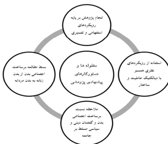
شکل (۳): مغفوله‌های مطالعاتی در پژوهش‌های مرور شده