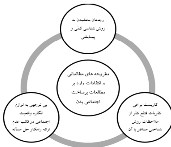
شکل (۲): مطروحه‌ها و انتقادات وارد بر پژوهش‌های مرور شده

همین امر، ضرورت کنترل و مدیریت بدن، در قالب جوان و شاداب نگاه داشتن آن را از طریق رویکردهای چندگانه تشدید می‌سازد؛ رویکردهایی که نوربرت الیاس از آن‌ها به عنوان اجتماعی‌سازی بدن، عقلانی‌سازی بدن، و شخصی‌سازی آن یاد می‌کند. (Shilling, 1993:181-186).