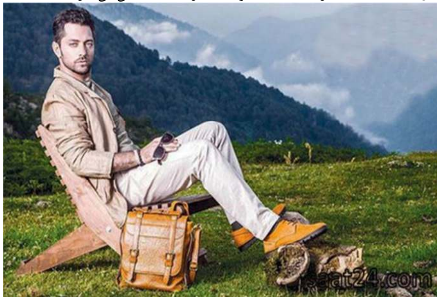
تصویر شماره ۲- بهرام رادان در آگهی تبلیغاتی چرم نوین مشهد در نشریه زندگی ایرانی

تاریخی نقش مردان اساسا با کارشان تعریف می شود، امروزه دنیای مردان در تصاویر تبلیغاتی بیشتر بر محوریت اوقات فراغات و خرید کالاهای مصرفی می باشد (بیگنل، ۱۳۹۳: ۶۴) (تصاویر ۱، ۲، ۳ و ۴). بدین سان دنیای مردان در تصاویر تبلیغاتی بر علایق و فعالیت های محوریت دارد که بیرون از حوزه کار بازنمایی می شوند.