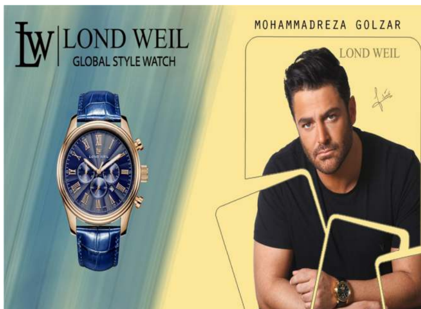
تصویر شماره ۱- آگهی تبلیغاتی ساعت لوند ویل در مجله سیب سبز

آگهی تبلیغاتی ساعت لوند ویل از نشان شمایل گون محمد رضا گلزار در کنار محصول خود یعنی: ساعت مردانه لوند ویل استفاده کرده است. در بالای صفحه لوگوی برند با فونت درشت و در زیر آن جمله Global Style watch درج شده است. دو رنگ زرد و آبی برای پس زمینه تصویر آگهی تبلیغاتی به کار رفته است.