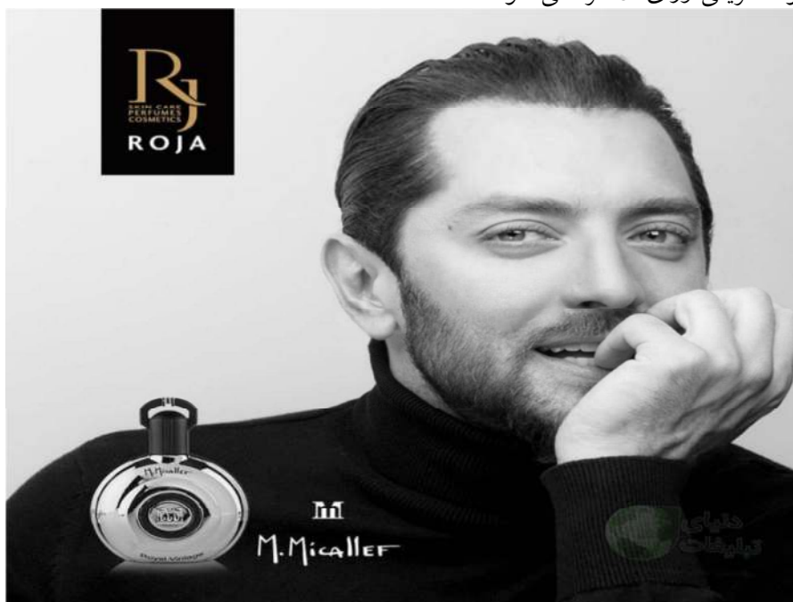
تصویر شماره ۴- بهرام رادان در آگهی تبلیغاتی محصولات آرایش رژا نشریه سیب سبز

نگاه خیره را به‌مراه می‌آورد. اگر تا پیش از این نگاه خیره، مطلوب مردانه ای بود که در رابطه با سوژه جنسی زن برساخت می‌شد. اکنون تبلیغات با به تصویر کشیدن بدن مردانه به عنوان دلالتی زیباشناختی و اروتیک نگاه خیر مردان و همچنین زنان را به بدن مردانه دعوت می‌کنند. بدین سان نه تنها اروتیزه شدن سبک زندگی مردان در آگهی‌های تبلیغاتی بازنمایی می‌شود بلکه الگوهای از استانداردها شدن زیبایی نیز برساخت می‌گردد که هر گونه تعریفی ورای آن طرد می‌شود