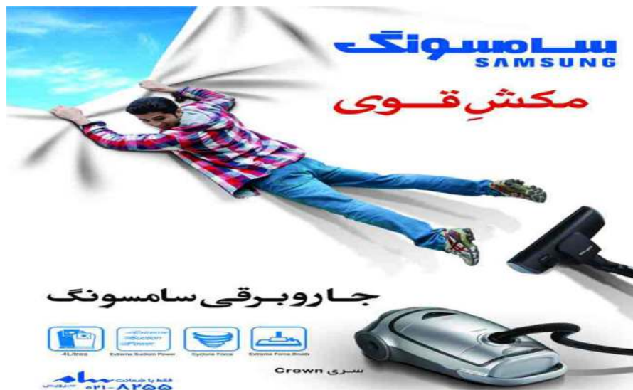
تصویر شماره ۶- آگهی تبلیغاتی سامسونگ در نشریه سیب سبز

با این حال آنچه در تصاویر تبلیغاتی محصولات شوینده و کالای آشپزخانه بازنمایی می شود صرفاً حضور مردانه و غیاب تصویر زنانه نیست بلکه تقابل دوگانه ای است که در اینگونه آگهی های برساخت می شود. در حقیقت درحالی که آگهی های تبلیغاتی محصولات آرایشی و کالای لوکس تلاش می کنند تا با استفاده از سلبریتی های زیبا، جذاب و خوش اندام دلالت های آن را به کالای خود انتقال دهند. در تبلیغات محصولات شوینده و کالاهای خانگی که با هم نشینی مردان روایت شده است در تقابل با محصولات آرایشی ما با مردانی لاغر و ضعیف مواجه هستیم که در آن هیچگونه دلالت های آشکاری از اندام ستبر و جذابیت ظاهری که تا پیش از این در دیگر آگهی های تبلیغاتی در راستای باز تعریف مردانگی بازنمایی می شد، دیده نمی شود. اگر چه آگهی های تبلیغاتی تلاش می کنند تا نزدیکی نقش ها را در میان مردان و زنان بازنمایی کنند با این حال آنچه که بیش از همه اتفاق می افتد هژمونی برخی از نقش ها بر دیگری است. بدین سان هژمونی مصرف کالای لوکس و زیبایی مردان بر نقش مردان در کارهای خانه پیشی می گیرد. در حقیقت اگرچه سرمایه داری برساخت معنایی از تغییر نقش ها مبتنی بر مصرف را روایت می کند با این حال در یک اولویت بندی کماکان کلیشه های جنسیتی و تابوهای آن به اشکال نوین برساخت می شود (تصویر شماره ۵ و ۶).