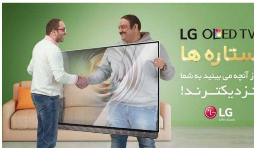
تصویر شماره ۳- مهران غفوریان در آگهی تبلیغاتی تلویزیون های ال جی در نشریه زندگی آرمانی

این دنیای مردانه جدید دنیای مصرف است که نه فقط شامل خرید کردن بلکه مصرف کردن فیزیکی نیز باشد (بیگل، ۱۳۹۳: ۶۴). اگر تا پیش از این، فرهنگ مصرفی برساختی از نقش زنان در رسانه های بازنمایی می شد، سرمایه داری تلاش کرد تا این فرهنگ را در دنیای مردانه ایجاد کند تا منابع ارزش افزوده بیشتری را جلب کند. در این میان ورود مردان به دنیای مدلینک و بازنمایی آنان به عنوان مصرف کننده نقطه عطف نزدیکی دنیای زنانه و مردانه را بوجود آورد. از اینرو، بازتولید مردان با جذابیت های ظاهری، که محصولات مراقبت از پوست و مو مصرف می کنند و در دنیای مدلینک فعالیت می کنند مفهومی جدید با عنوان "زنانه شدن مردانگی" را برساخت کرد (تصویر شماره ۳ و ۴). اگر تا پیش از این مصرف در حیطه زنان و نیازهای آنان بازنمایی می شد و هژمونی تبلیغات در عرصه نیازهای زنانه بازتولید می شد با ورود مردان به دنیای مدلینک مصرف به حوزه مردانه نیز رسوخ کرد. آگهی تبلیغاتی محصولات آرایشی روزا با هم نشین کردن بهرام رادان به عنوان یک سلبریتی در کنار محصول خود، ادکلن، تلاش می کند دال های چون جذابیت، زیبایی سلبریتی را به عنوان نشانه های کلیشه ای به کالای خود دلالت دهد. در این میان بردار مستقیم رادان به مخاطب نه تنها دلالتی بر اعتماد به نفس و موفقیت می باشد بلکه مخاطب را به رمز گشایی فرا می خواند. داستان گره کرده و لبخند ملیح او دلالت آشکار بر قدرت و موفقیت او است. بطور کلی آگهی تبلیغاتی روزا نه تنها نشانه های کلیشه