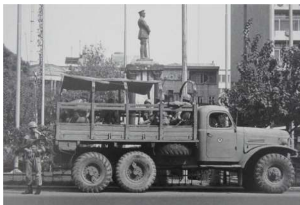
شکل ۷. پاسداری مردان شاه از فضاهای شاهانه.

تا پیش از این، مردان شاه با تسخیر مسلحانه فضا توسط کامیون‌های نظامی و تانک‌های ارتشی در عرصه خیابان قدرت‌نمایی می‌نمودند و سعی در ایجاد احساس رعب و وحشت داشتند (شکل ۷). مردان اردوگاه شاه برای دفاع از تمدن بزرگ احساس ترس را گسترش می‌دادند و مردان اردوگاه انقلاب احساس رشادت و وفاداری به انقلاب را توسعه می‌دادند. گویی دو رژیم احساسات در برابر یکدیگر قرار گرفته بود.