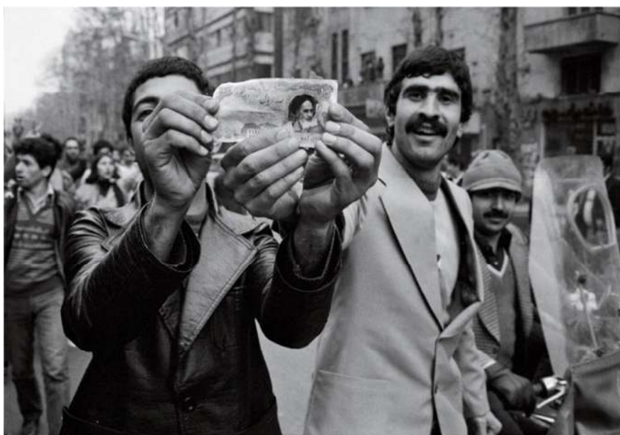
شکل ۲. جایگزین نمودن تصویر آیت‌الله خمینی به جای تصویر محمدرضاشاه توسط مردان انقلابی. دیوید برنت (Burnett, 2009: 103)

انقلاب اسلامی ایران نیز به همان میزان پایانی بر حکومت مردان شاه و شروعی بر آغاز مرد انقلابی و مجاهد بود. مرد انقلابی بر اساس احساسات به خروش آمده‌اش برای تغییر و تحول به دنبال جایگزین کردن رهبر مرد انقلابی در برابر مرد مستبد حکومتی بود (شکل ۲).