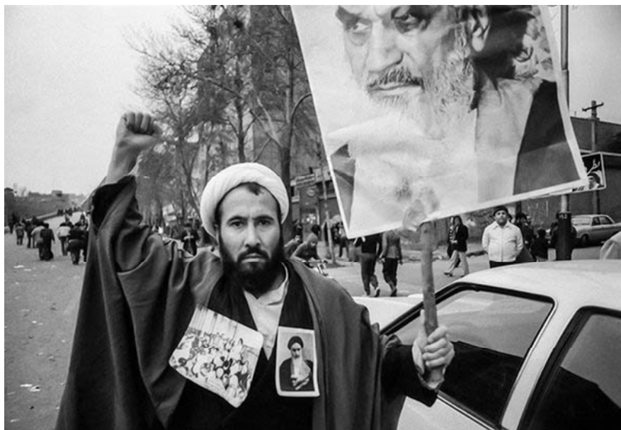
شکل ۴. بدن مرد انقلابی به مثابه دیوار.