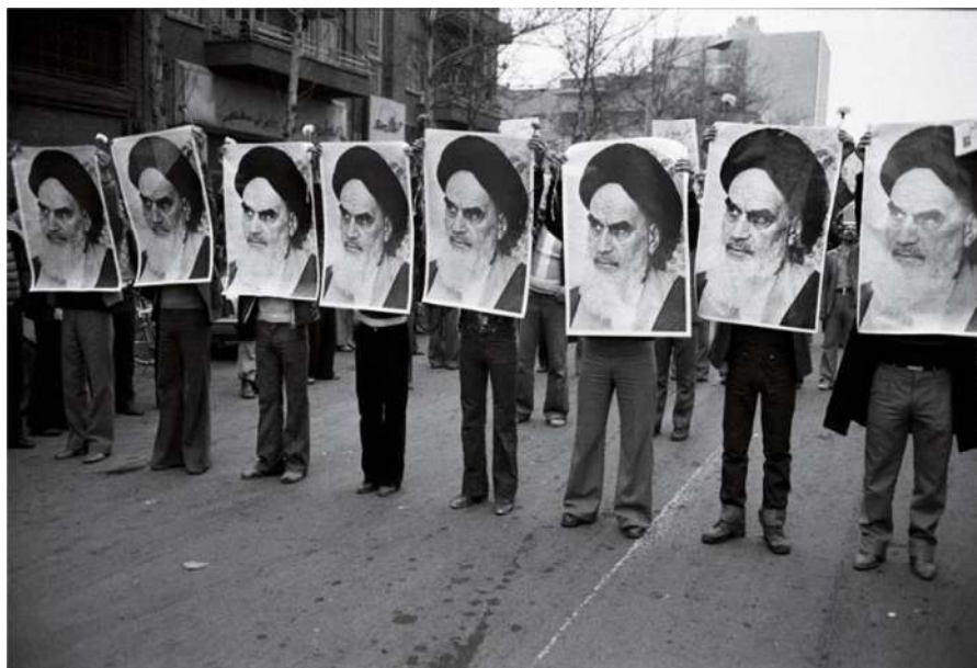
شکل ۳. کارکرد هویت‌ساز تصویر آیت‌الله خمینی در جریان اعتراضات خیابانی. دیوید برنت (Burnett, 2009: 108)

یکی از مهم‌ترین جنبه‌های احساسات مشترک در بین مردان انقلابی عشق به آیت‌الله خمینی و به دست داشتن تصاویر دست او بود. در برهه انقلاب آیت‌الله خمینی با شعارهای حمایت از مستضعفین و رویارویی با امپریالیسم توانسته بود توجه گروه‌های مبارز چپ را به سوی خود جلب کند. بنابراین، شکل‌گیری عشق به آیت‌الله خمینی زمینه‌ای را برای پیوند احساسی مردان انقلابی ایجاد می‌کرد به گونه‌ای که حتی عکس‌های آیت‌الله خمینی را بر روی سینه‌ها و بدن خود می‌چسبانند.