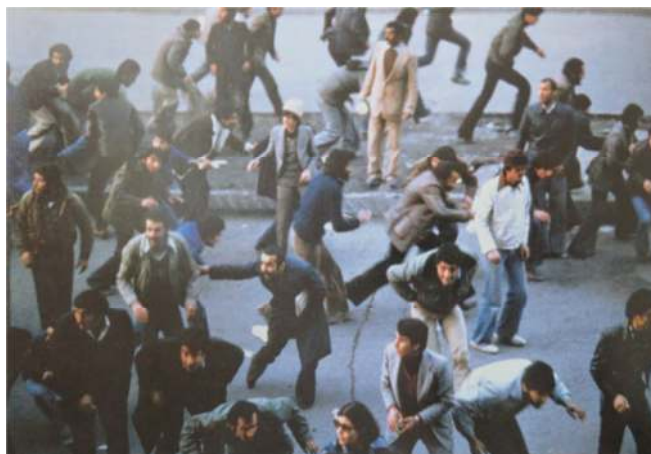
شکل ۵. تصویری از موقعیت فرار و اضطراب در جریان انقلاب ۵۷. دیوید برنت (Burnett, 2009: 150)

مرد انقلابی برای بیانگری و برون ریزی احساسات انقلابی خود نیاز به تولید فضا داشت. تولید فضا اشاره به ایجاد وضعیتی است که در آن بتوان زمان تحت انقیاد حکومت پهلوی را به زمان انقلابی تبدیل نمود. بنابراین، تولید فضای انقلابی به تولید زمان انقلابی نیاز داشت، زیرا زمان و فضا در رابطه‌ای متقابل با یکدیگر قرار دارد (Lefebvre, 2004: 8).