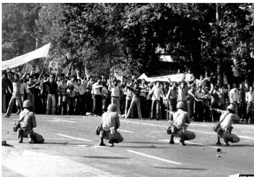
شکل ۱. رویارویی دو اردوگاه مردانی انقلابی در برابر مردان ارتشی شاه. نامعلوم (Jahanbegloo, 2019)

بر اساس آنچه آورده شد، نظام سیاسی مبتنی بر مردان ارتشی در پهلوی نهاده شده و به پهلوی دوم رسید. محمدرضا شاه هم به‌مثابه فرمانده کل ارتش تمامی پشتوانه‌اش را بر اساس مردان ارتشی تنظیم کرده بود و در جریان انقلاب آنچه نمایان شد جبهه‌ای از نبرد بین مردان ارتشی و مردان انقلابی بود. وضعیت انقلاب ماجرایی رویارویی دو اردوگاه مردانه در برابر یکدیگر بود (شکل ۱).