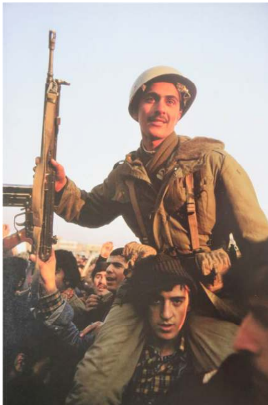
شکل ۱۰. کنار هم نشینی بدن‌های مردان انقلابی و شاه و از بین رفتن هویت قدیم مردان شاه، دیوید برنت (Burnett, 2009: 92)

ابر بدن پیروزی که در شکل بالا دیده می‌شود شدت احساسات مشترک انقلابی را هر چه بیشتر گسترده‌تر و بدنمندتر می‌کرد. گویی ماشین احساسات انقلاب در خیابان‌های شهر حرکت و هر آنچه از مردان ارتشی شاه بود را از آن خود می‌کرد و به درون خود فرو می‌برد. اتصال‌های جدیدی بین اجزای ساختار احساسات انقلاب در حال شکل گرفتن بود که می‌توانست آنچه زمانی تنها امکان رخداد آن وجود داشت را به جریانی عملی تبدیل کند.