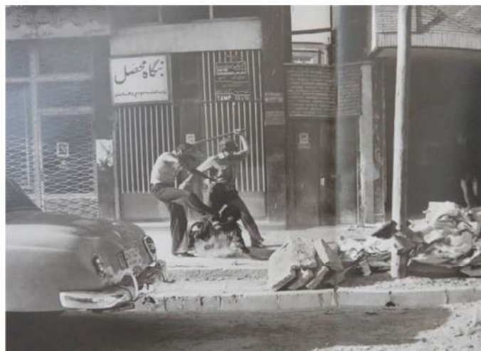
شکل ۸ به وجود آمدن درگیری فیزیکی به واسطه از بین رفتن فاصله میان دو گونه مردانگی. اباصلت بیات (بیات، ۱۳۹۷: ۱۵ و ۱۴)

نفرت از مرد اردوگاه روبه‌رو جریان انقلاب را به سوی مسلح شدن مردان انقلابی سوق می‌داد. به دست آوردن اسلحه و درست کردن ابزارهای مانند بمب‌های دستی نشان از تقلاي مردان انقلابی برای پاسخ دادن به احساس نفرت خود از مردان شاه است که نسبت به آنان خشونت به خرج می‌دادند. سنگریندی خیابان‌ها و به دست گرفتن اسلحه برای دفاع از اردوگاه انقلاب گویی جنبه‌ای نمادین از تاریخ ایران نشان می‌داد که اسلحه‌هایی که رضاشاه از جامعه ایرانی جمع کرد و در دست مردان ارتشی متمرکز ساخت حال دوباره از دست مردان ارتشی خارج می‌شود و به دستان مردم باز می‌گردد و شهر به تئاتری برای نبرد تبدیل می‌شود (Sassen, 2010: 38).