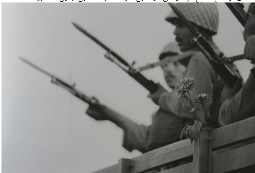
شکل ۱۲. گل، نمادی از خلع سلاح و پیوستن مردان شاه به جریان انقلاب. میشل ستبون (ستبون، ۱۳۹۵: ۴۰)

بنابراین، اهدای گل راهی برای از آن خود سازی مرد شاه توسط مرد انقلابی و غریبه‌زدایی از یکدیگر بود. مرد انقلابی با اهدای گل به مرد اردوگاه مقابل سعی داشت صمیمیت موجود میان دو اردوگاه را در فضایی تهی از سلسله مراتب نظم حکومتی به نمایش بگذارد (شکل ۱۲). در جریان انقلاب اهدای گل و پذیرفته شدن آن توسط مرد شاه به نمادی از خلع سلاح مرد ارتشی در مقابل خواسته مرد انقلابی تبدیل شده بود.