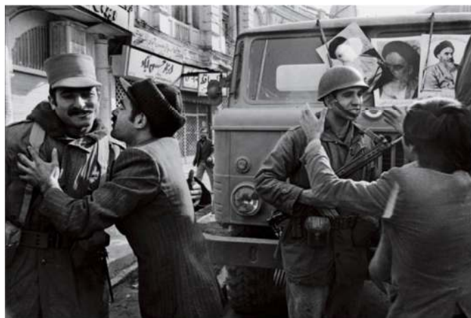
شکل ۱۱. به وجود آمدن عشق و پیوند بین مردان انقلابی و ارتشی. دیوید برنت (Burnett, 2009: 93)

ارتشی عشق و پیوند به وجود می‌آمد و عشق حاصل ابراز وفادری است (Badiou, 2005: 233) که مردان ارتشی از پیوستن به مردان انقلابی نشان می‌دادند. انگار طیفی از مردانگی منسجم از مردان انقلابی تا مردان ارتشی که نیروی عشق پیوند دهنده آنان است به وجود آمده بود. بنابراین، انقلاب بیشتر درباره عشق و جماعتی است که عاشقانه عمل می‌کند (Jones, 2011: 42). نشان دادن تعهد و وفاداری به انقلاب حاکی از اهمیت مؤلفه عشق به نیروها و جریان انقلاب است (Jansen, 2019: 242). پس لحظه آشکار شدن پیوند مردان ارتشی به مردان انقلابی زمان شکل‌گیری عشق، عهد، و ابراز وفاداری به جریان پیروز انقلاب ۵۷ است. از این رو، عشق صحنه بروز حقیقت است (May, 2009: 263) و آن حقیقت شکل‌گیری دوره جدیدی از مردانگی در تاریخ معاصر ایران بود.