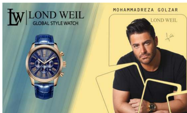
تصویر ۱. آگهی تبلیغاتی ساعت لوند ویل در مجله سب سبز