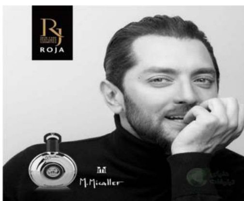
تصویر ۴. بهرام رادان در آگهی تبلیغاتی محصولات آرایش روژا، نشریه سب سبز

ابژگی را در آگهی تبلیغاتی روژا نیز می‌توان دید (تصاویر ۱ و ۳). بدن مردانه در تعریف سنتی مردانگی، دلالتی صریح بر قدرت بود که خود بر بخش مهمی از مردانگی دلالت داشت و به‌عنوان مؤلفه‌ای در رابطه با تولید قرار می‌گرفت (مکینون ۲۰۰۳: ۳۱)؛ اما تبلیغ لوند ویل و روژا در چرخشی معنایی، بدن عضلانی سلبریتی را کمال مطلوب فیزیک مردانه می‌داند که آن را دلالتی ضمنی از زیباشناختی و ابژه جنسی بازنمایی می‌کند (تصاویر ۱ و ۳). باین‌حال، صرفاً بدن عضلانی سلبریتی دلالت بر ابژه جنسی بودن او ندارد، بلکه رنگ پوست برنزه مدل نیز بازتولیدی از اروتیک‌بودن اوست. درحقیقت آگهی تبلیغاتی فوق با به‌چالش کشیدن اسطوره سنتی مردانگی، که با کار و قدرت بدنی همراه بود و خشونت جزء لاینفک آن بود، اسطوره نوینی بازتولید کرد که در آن هژمونی زیبایی، جذابیت ظاهری، ابژه جنسی، و شیک‌پوشی برساختی از مردانگی جدید به‌همراه داشت. در این تقابل دوگانه مردانگی نگرشی ضدجنسیتی به‌تصویر کشیده می‌شود؛ بنابراین، مرد می‌تواند زیبا، جذاب، و اروتیک باشد و کماکان مردانه به‌نظر برسد. در این میان امری که بیش از همه رخ می‌دهد تبدیل بدن به سرمایه جنسی است. بدن آهنین مردانه نه‌تنها دلالتی بر زیبایی و شهوانیت اوست، بلکه نگاه خیره را به‌همراه می‌آورد. اگر تا پیش از این نگاه خیره مطلوب مردانه‌ای بود که در رابطه با سوژه جنسی زن برساخت می‌شد، اکنون تبلیغات با به‌تصویر کشیدن بدن مردانه به مثابه دلالتی زیباشناختی و اروتیک، نگاه خیره مردان و هم‌چنین زنان را به بدن مردانه دعوت می‌کند. بدین‌سان، نه‌تنها اروتیزه‌شدن سبک زندگی مردان در آگهی‌های تبلیغاتی بازنمایی می‌شود، بلکه الگوهایی از معیارشدن زیبایی نیز برساخت می‌شود که هرگونه تعریفی و رای آن طرد می‌شود.