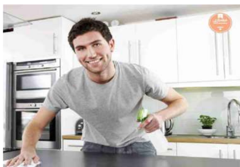
تصویر ۵. آگهی محصولات شوینده در مجله زندگی ایدئال

این نزدیکی نقش‌ها صرفاً در آگهی‌های تبلیغاتی کالای لوکس باقی نماند، بلکه تلاش شد مردان به‌عنوان همراه همیشگی زن در عرصه زندگی روزمره بازنمایی شوند، درحالی‌که در هژمونی مردانه سنتی «مرد واقعی» براساس رابطه‌اش با زن تعریف می‌شود و در این تعریف هیچ‌گاه نباید در کلیشه‌های جنسی و نقش‌های زنانه روایت شود (بارنون ۱۹۷۶: ۳۲). هم‌نشینی مردان در آگهی‌های تبلیغاتی محصولات شوینده و کالای خانگی مجلات خانوادگی و جانشینی آنان با تصاویر زنان را که تا پیش از این به کلیشه‌های زنانه برساخت می‌شد می‌توان از این دست تبلیغات دانست. درحقیقت حضور مردان در آگهی‌های تبلیغاتی محصولات شوینده و کالاهای آشپزخانه و غیاب زنان در این آگهی‌ها نه‌تنها ورود مردان را به این حیطه روایت می‌کند، بلکه تلاش می‌شود تصویر ضدجنسیتی کلیشه‌ای از مرد سنتی خشن را که پیش از این در دیگر رسانه‌ها بر ساخت می‌شد به‌گونه‌ای تلطیف کند. این چنین تصاویر تبلیغاتی زنجیره‌ای از تصاویر منفی را که هژمونی مردانه را طبیعی‌سازی می‌کنند تحمیل نمی‌کند، بلکه وجهی خانواده‌دوست و همراه را از مرد به‌تصویر می‌کشد (تصویر ۵ و ۶).