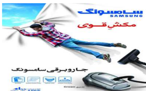
تصویر ۶. آگهی تبلیغاتی سامسونگ در نشریه سیب سبز