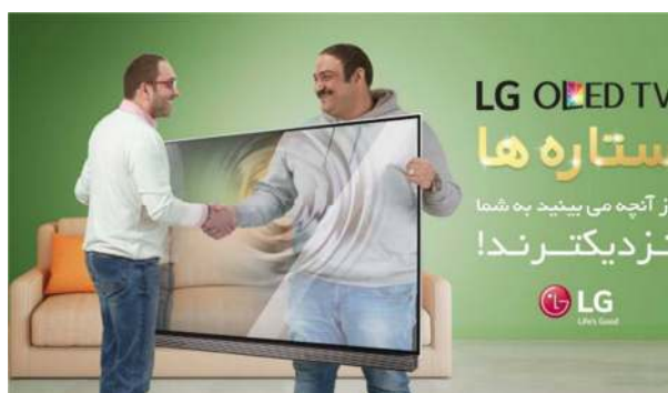
تصویر ۳. مهران غفوریان در آگهی تبلیغاتی تلویزیون‌های ال‌جی در نشریه زندگی آرمانی

در تعریف اسطوره مردانگی نوین که آگهی‌های تبلیغاتی آن را بازنمایی می‌کنند، مرد نوین کسی است که برای آخرین ابزارهای الکترونیک، لباس، محصولات زیبایی، و مد پول خرج کند (تصویر ۱، ۲، ۳، و ۴).