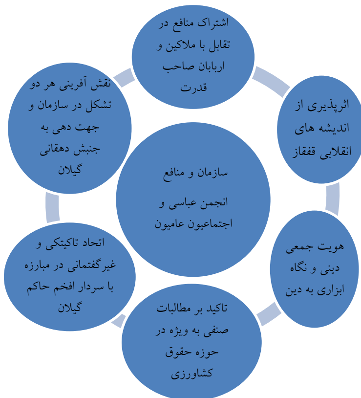
الگوی شماره دو: مدل بسیج منابع؛ سازمان و منافع