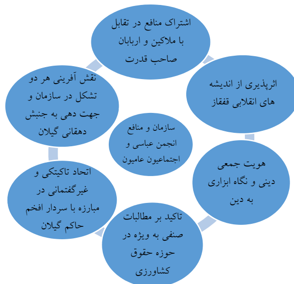
الگوی شماره دو: مدل بسیج منابع: سازمان و منافع