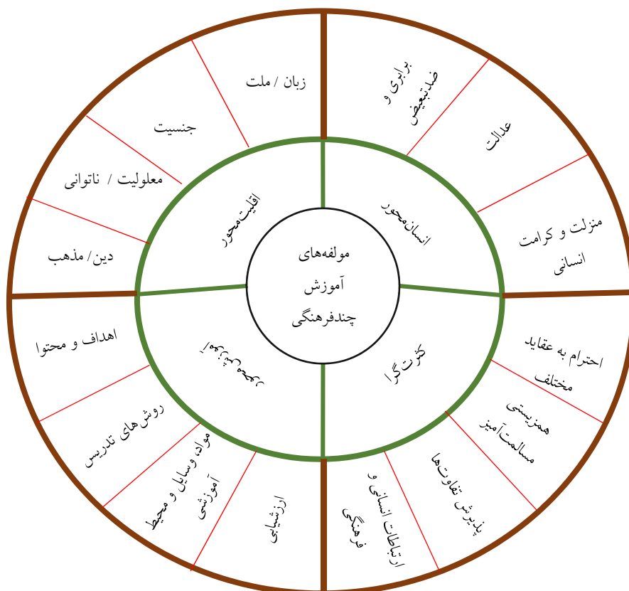
شکل ۲. مضامین اصلی و فرعی شناسایی شده آموزش چندفرهنگی