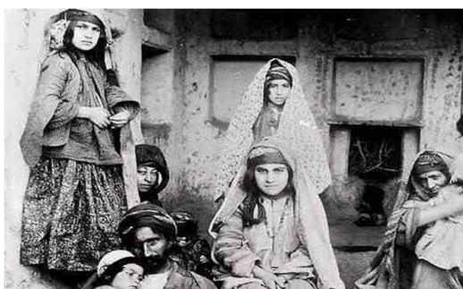
تصویر شماره ۱۷: یک خانواده لرستانی، اواخر حکومت قاجار، سوروگین، ۱۳۷۸.

در غیاب خان، زنش خانه را اداره می‌کرد. کت مخمل قرمز به تن داشت و کمرش را حاشیه‌ای از یراق‌های زرین و برق‌دار فراگرفته بود. کت را روی پیراهن بلند زنانه نخعی گشاده با گل‌های زردرنگ پوشیده بود. شب در چادر مخصوص زنان خوابیدم. رفتارشان مهرآمیز بود (استارک، ۱۳۶۴: ۹ و ۱۲ و ۴۳)