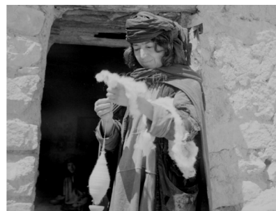
تصویر شماره ۶: پشم ریزی، هارلی، ۱۲۹۹ شمسی