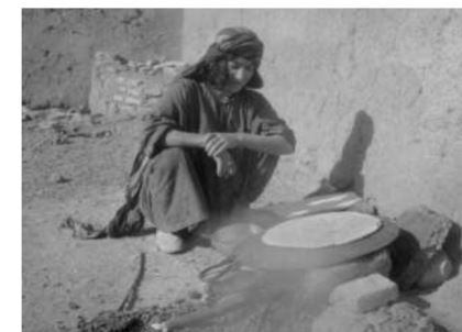
تصویر شماره ۴: پخت نان، ، ۱۲۹۹ شمسی