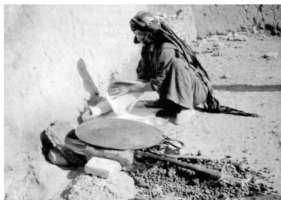
تصویر شماره ۳: پخت نان، هارلی، ۱۲۹۹ شمسی