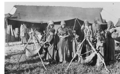
تصویر شماره ۱: زنان ایلات در حال مشک زنی، امیر خان جلیل الدوله قاجار، ۱۲۷۹ شمسی.