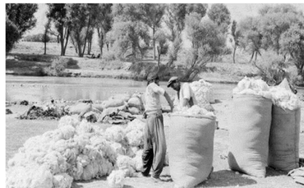
تصویر شماره ۱۱: پشم‌چینی، هارلی، ۱۲۹۹ شمسی