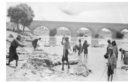
تصویر شماره ۱۰: پشم شویی زنان و مردان، ، ۱۲۹۹ شمسی