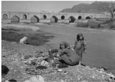
تصویر شماره ۹: شست‌وشو در رودخانه خرم‌آباد، ، ۱۲۹۹ شمسی