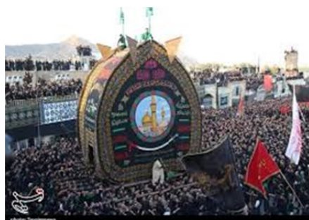
تصویر نخل گردان در استان یزد

وقتی مسأله عزاداری به حد اعلاء اجتماعی و فرهنگی خود می‌رسد، بیانگر واقعیت‌های جمعی مناسک دینی و آیینی مختص یک فرهنگ بومی می‌شود که هدف آن برانگیختن، زنده نگه‌داشتن یا بازسازی برخی حالت‌های ذهنی برگرفته از خاطرات دینی هر فرد است.