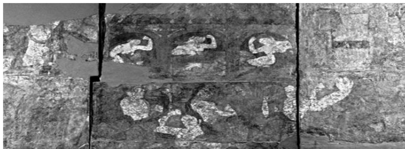
تصویر زنان نوحه‌گر در موزه آرمیتاژ

ایرانیان در قرون پس از ساسانیان در سوگ سیاوش جلساتی می‌گرفتند و از روزگار گذشته یاد می‌کردند (اوشیدری، ۱۳۸۶: ۳۳۷).