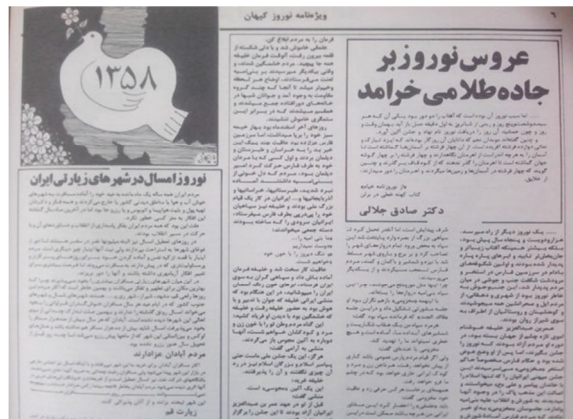
تصویر ۴. تشویق مردم برای حضور در شهرهای زیارتی در نوروز