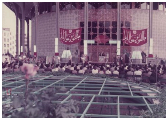
تصویر ۱۲. حضور مسئولین در جشن نیمه‌ی شعبان، تئاتر شهر دهه‌ی ۶۰»