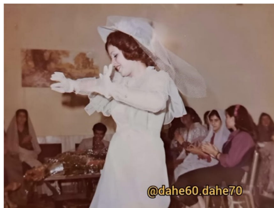
تصویر ۱۶. رقص در جشن عروسی، سال ۱۳۶۰، اراک

در دهه‌ی شصت اگر ضبط‌صوتی بود که اغلب هم بود و از این بزرگ‌ترها که بهش می‌گفتند استریو، خیلی خوب، اگر هم نبود، کار بزن و برقص با تمپو یا حتی یک دبه ترشی راه می‌افتاد و چه حالی می‌داد (چلچراغ، ۱۳۹۵).