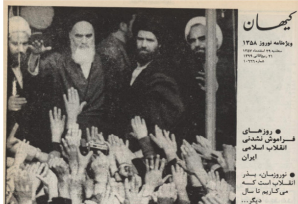
تصویر ۳. جشن نوروز در پیوند با انقلاب