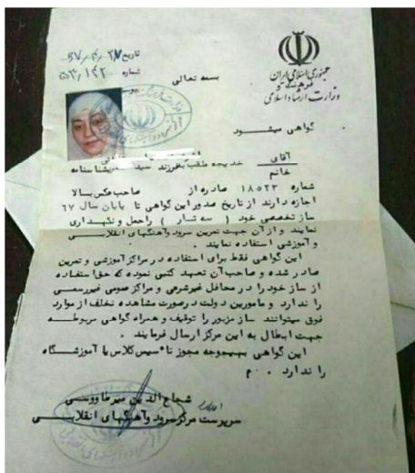
تصویر ۱۵. مجوز حمل ساز صرفاً برای مراکز آموزشی و تمرین بدون حق استفاده در محافل غیرشرعی و مراکز عمومی غیررسمی، ۱۳۶۷

اصلاً جرئت نداشتم سازم را با خودم بیرون ببرم، حتی کارت تردد برای ساز داشتیم. به یاد ندارم با ساز بیرون رفته باشم و در خیابان کسی جلوی من را نگرفته باشد. معمولاً پاسداری می‌آمد و با تند می‌پرسید: این چیه؟ با ترس و لرز می‌گفتم والا این ساز است. باهاش خمینی ای امام می‌زنیم. بعضی‌ها که منطقی تر بودند می‌گفتند: آها، خمینی ای امام! آها موسیقی! اما بعضی‌هایشان که سخت‌گیرتر بودند، ما را به کمیته می‌بردند. چند باری به کمیته رفتم. دوباره آن سؤال‌ها از نو. ساز را درمی‌آوردند و مدام ما باید می‌گفتم آقا تو رو خدا اینجاش به میز نخورد، احتیاط کنید، قیمتی است. راستش آن موقع از مردم هم می‌ترسیدم. آن‌ها هم گاهی با لحن بدی می‌پرسیدند یا بد نگاه می‌کردند. حسم این بود که آن‌ها هم می‌گویند که این‌ها طاغوتی‌اند (ایسنا، ۱۳۹۶).