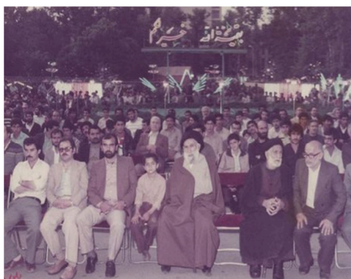
تصویر ۱۳. مردم و مسئولین در نیمه‌ی شعبان، سالن تئاتر شهر، دهه ۶۰