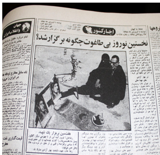
تصویر ۱. بازنمایی نوروز در پیوند با مفهوم شهادت

کلمه عید نوروز آمده بود، امام فرمودند عید را حذف کنید. فقط نوروز بنویسید (رحیمیان، ۱۳۷۰: ۲۲۷).