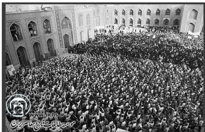
تصویر ۵. حضور مردم و آیت‌الله خامنه‌ای در صحن آستان قدس رضوی، نوروز، دهه‌ی شصت

بعد از انقلاب تلاش شد تا تجربه‌ی عید نوروز به میانجی شهرهای زیارتی و صحن‌های امامان و امامزاده‌ها برای مردم صورت گیرد. نهادهای رسمی تلاش داشتند تا شکلی نو از جشن گرفتن را به‌عنوان الگوی مطلوب، در فضای عمومی کشور بازنمایند و در خصوص آن فرهنگ‌سازی کنند. تشویق مردم برای حضور در زمان تحویل سال در شهرهای زیارتی مشهد و قم و در جوار امامزادگان، حضور در مزار شهدا و پهن کردن سفره‌های هفت‌سین نمادین در این مکان‌ها، بخشی از این سیاست و الگوسازی‌ها بود. در واقع بزرگداشت سال نو به میانجی زیارتگاه‌ها، بخشی از سازوکار به انقیاد درآوردن جشن‌های ملی و عرفی بود. صحن حرم‌ها و امامزاده‌ها مکان‌هایی بود که جشن‌های عرفی را دربند و قید قرار می‌داد و آن‌ها کنترل‌پذیر می‌کرد. از خلال این‌گونه سیاست‌گذاری‌ها بود که برخی جشن‌های ملی همچون چهارشنبه‌سوری از اساس حذف و بقیه همچون نوروز به انقیاد درمی‌آمد.