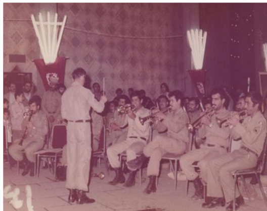
تصویر ۱۴. اجرای گروه سرود، نیمه‌ی شعبان، سالن تئاتر شهر، دهه ۶۰

به‌علاوه تلاش می‌شد تا جشن‌های عرفی و خانوادگی نیز در فضاهای معنوی و مطلوب حکومت و با الگویی مطابق خواست حاکمیت برگزار شوند: