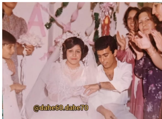
تصویر ۱۷. شادی در جشن عروسی، سال ۱۳۶۷، مسجد سلیمان

جریان تکثیر نوارهای کاست که فرایندی مرکزمند در قبل از انقلاب بود، به جریانی سیال و سلیقه‌ای تبدیل شده بود که یا مردم در هنگام عروسی‌ها و جشن‌های تولد سراغ آن‌ها را از هم می‌گرفتند یا برای تهیه‌ی آن به بازار سیاه مانند خیابان لاله‌زار که مرکز پخش موسیقی در قبل از انقلاب و حال مرکز زیرزمینی آن شده بود، سر می‌زدند (طاهری کیا، ۱۴۰۰: ۱۶).