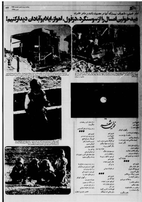
تصویر ۹. نمونه‌ای از غلبه‌ی گفتمان جنگ بر نوروز،