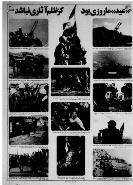
تصویر ۱۰. «غلبه‌ی گفتمان جنگ، تصاویر حضور رزمندگان در جبهه‌ها در نوروز»، روزنامه‌ی اطلاعات، ۲۸ اسفند ۵۹، ص ۲۲»

به موازات پس زدن و استحاله‌ی جشن‌های ملی، جشن‌های مذهبی مطابق با تقویم اسلامی، پررنگ و باشکوه برگزار می‌شد. برای مثال تئاتر شهر تهران در سال‌های ۶۱ تا ۶۳ میزبان جشن‌های نیمه‌ی شعبان بود. این جشن‌ها در محوطه پارک دانشجو و ساختمان و سالن اصلی تئاتر شهر برگزار می‌شدند. جشن‌ها هر سال به مدت یک هفته شامل سخنرانی، اجرای برنامه توسط گروه سرود، مولودی‌خوانی و برپایی نمایشگاه بود و در چهارراه ولیعصر، طاق نصرت بزرگی برپا می‌شد.