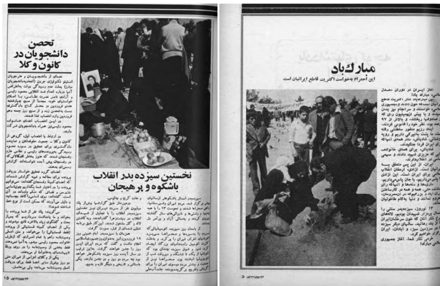
تصاویر ۷ و ۸. حضور مردم در گلزار شهدا، ۱۳ فروردین سال ۵۸،