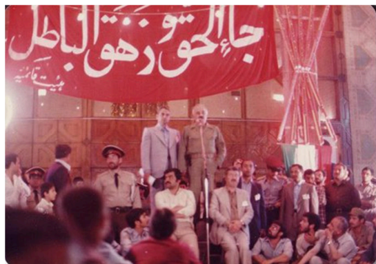
تصویر ۱۱. فضای رسمی جشن نیمه‌ی شعبان، سال ۱۳۶۲، تئاتر شهر

حیات جشن در زندگی روزمره دهه شصت ایران (فاطمه لطفی و دیگران) ۲۱۵